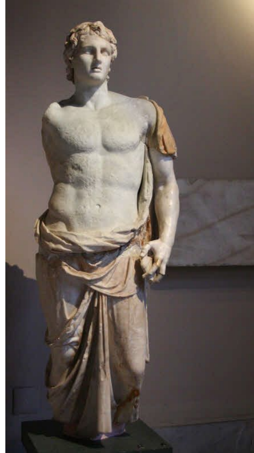
Koning van Macedonië: Alexander de Grote